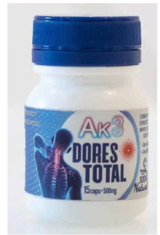
Ak3 DORES TOTAL; 15 caps; 500 mg.