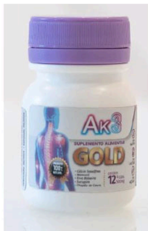
Ak3 SUPLEMENTO ALIMENTAR GOLD - EXTRA FORTE; PRODUCTO 100% NATURAL; contem 12 caps, 500 mg.