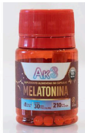
Ak3 SUPLEMENTO ALIMENTAR EM CÁPSULAS - MELATONINA; PRODUCTO 100% NATURAL; zero GLUTEN; contem 30 caps; peso líq. 60 g, 210 mcg na porção