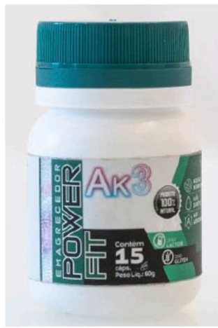
Ak3 EMAGRECEDOR POWER FIT; PRODUCTO 100% NATURAL; zero LACTOSE; zero GLUTEN; contem 15 caps.; Peso líquido 60 g.