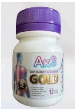
SUPLEMENTO ALIMENTAR marca Ak3 GOLD; Contem 12 caps 500 mg; Producto 100% natural; Isento de registro de conforme RDC N° 27 de 2010 e 240 de 2018; Fabricado 06/2024; Validade: 06/2026.

A continuación se detallan las imágenes de los productos en cuestión: