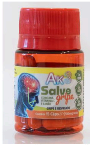
Ak3 Salve gripe; CÚRCUMA; VITAMINA C E LIMÃO; GRIPE E RESFRIADO; contem 15 caps; 500 mg.