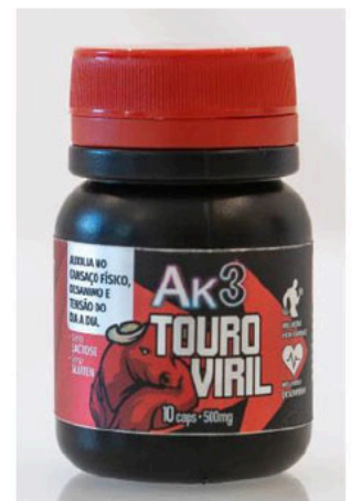
Ak3 TOURO VIRIL; 10 caps; 500mg; zero LACTOSE; zero GLUTEN